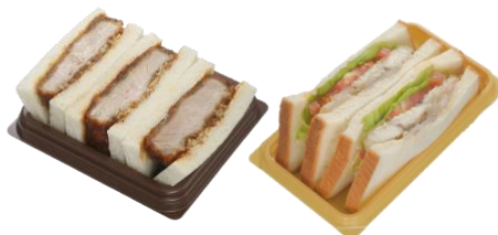
サンドイッチいずれか1品