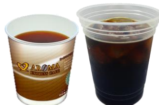
ホットコーヒーor アイスコーヒー/1杯