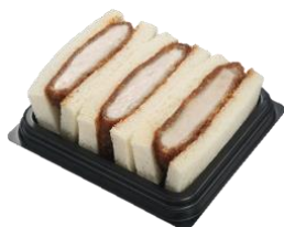
サンドイッチいずれか1品

モーニングセット・ワンコインモーニングセット（※1）は引き続き行っておりますのでご利用ください。