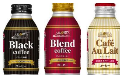
AROMA EXPRESS CAFE いずれか1品