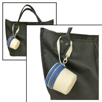
長めのストラップなので、カバンの取っ手やキャリアハンドル等、好きな場所に取り付けられます。