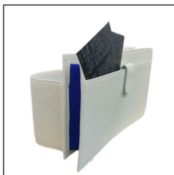
背面には、きっぷやスマートフォン等を入れられるポケット付き。