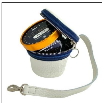
シカセンスゴ イタアイズが1個入るアイスクリームケース