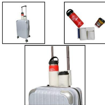
商品の大きさに合わせられるように、ドリンクホルダー部分の高さは2種類。